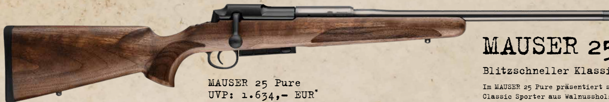
MAUSER 25 Pure UVP: 1.634,- EUR*

Gesamtlänge: 100,5 cm | Gewicht: ca. 3,2 kg