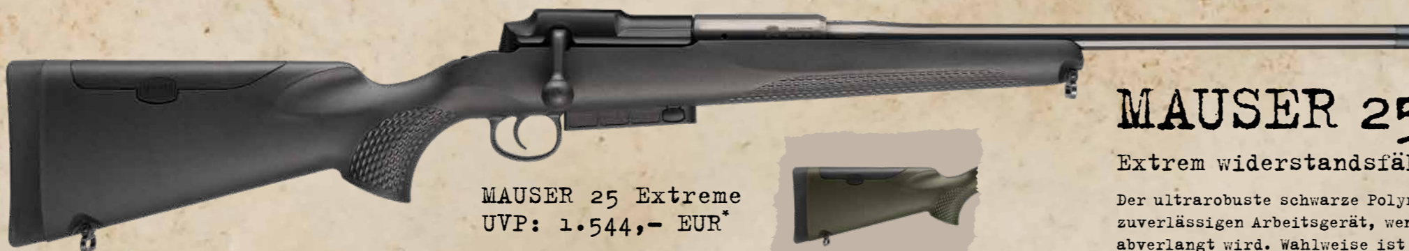
MAUSER 25 Extreme UVP: 1.544,- EUR*

Gesamtlänge: 100 cm | Gewicht: ca. 3,6 kg