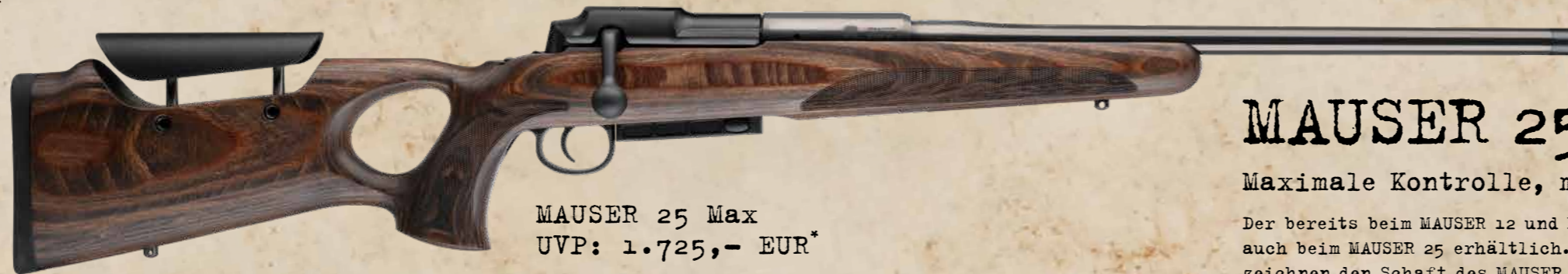
MAUSER 25 Max UVP: 1.725,- EUR*

G leich drei Varianten bilden das Startportfolio des MAUSER 25. Von der Modellvariante Pure mit ihrem Classic-Sporter-Walnußschaft über den MAUSER 25 Extreme mit widerstandsfähigem Polymerschaft bis hin zur Max-Variante mit ergonomischem Schichtholzlochschaft: Allen drei Varianten ist eines gemeinsam – sie stehen für bedingungslose MAUSER-Qualität, Präzision und einen absolut flüssigen und schnellen Geradestutzenverschluss, der in dieser Preisklasse seinesgleichen sucht!